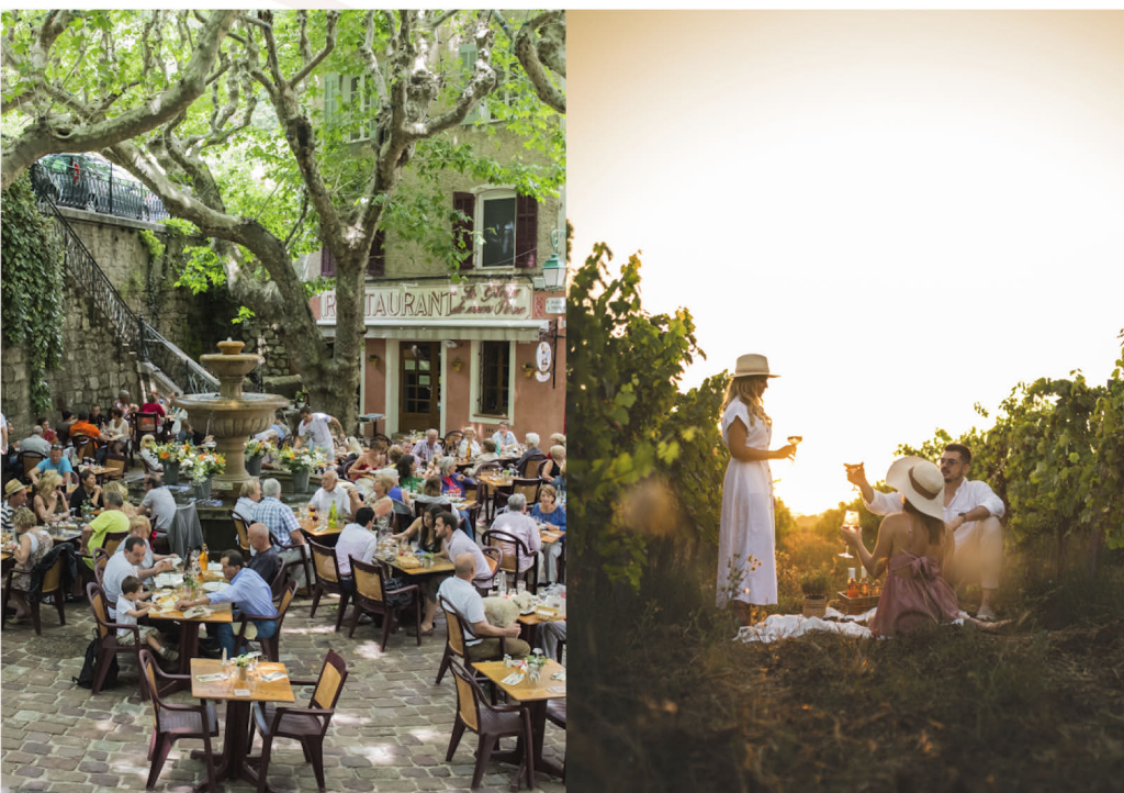
La Gloire de Mon Père

Au château Vaudois, fleuron de l'œnotourisme à Roquebrune-sur-Argens, le temps s'écoule lentement. L'espace d'un instant, il semble même s'arrêter. Au milieu des vignes, en famille ou entre amis, le pique-nique au Château Vaudois est un véritable moment de partage. Le repas est élaboré par le chef à partir de produits frais et locaux et accompagné d'un verre de rosé.