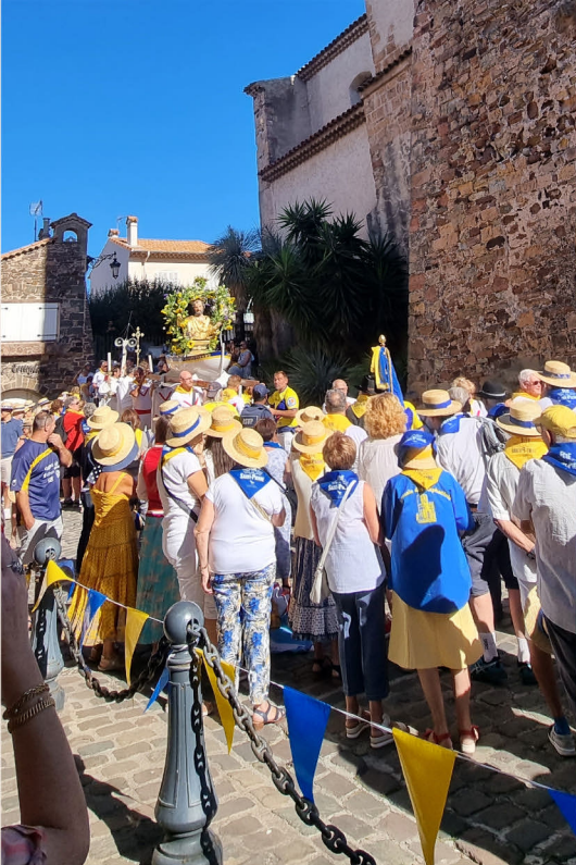
Fête de la Saint-Pierre, Saint-Raphaël