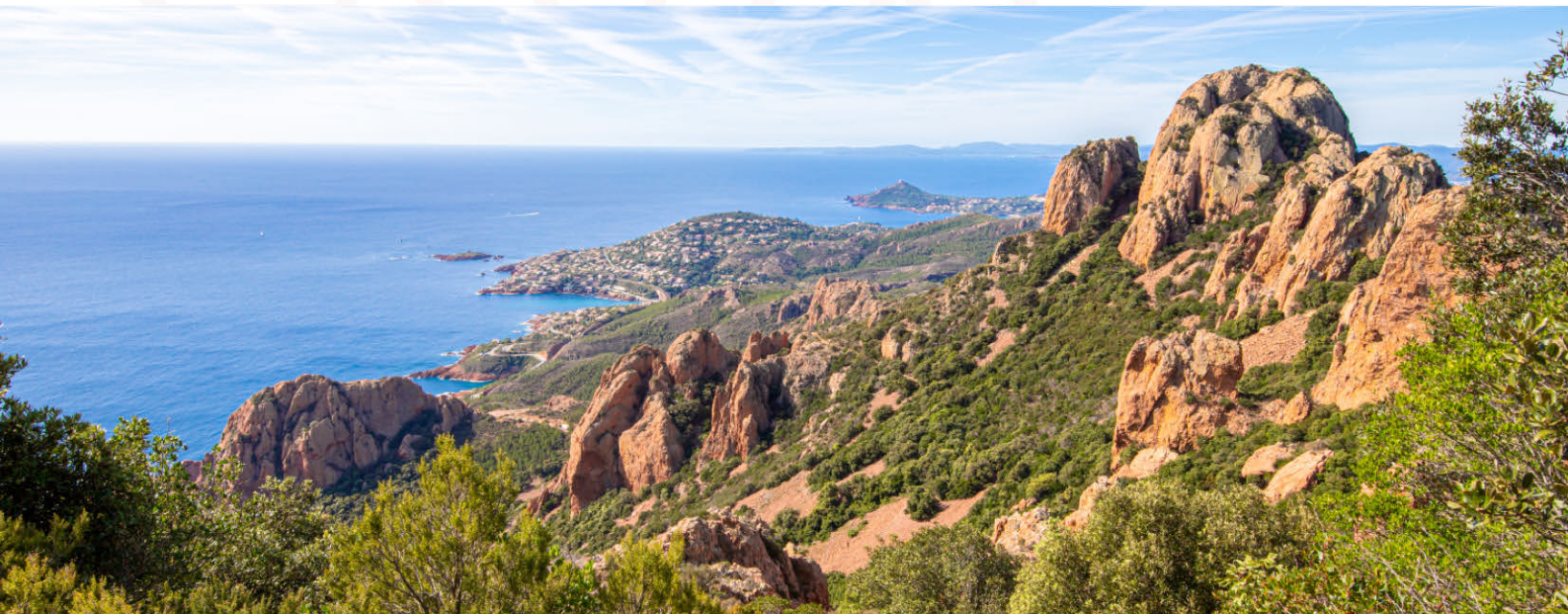
Pic du Cap Roux, Massif de l'Estérel, Saint-Raphaël