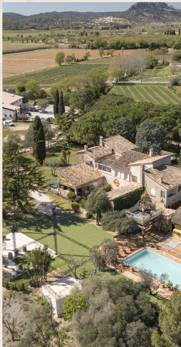
Mas des Escaravatiers

In the summer, the Mas welcomes festival-goers around the swimming pool for concerts under the stars. On Sundays, it's also an opportunity to have fun and enjoy a brunch while admiring the incredible view over the vineyards. Next door is the Mas d'hiver, a place for sharing and socialising over warm evenings. Good music, conviviality and a magnificent sunset over the Rocher de Roquebrune. More than just a venue, the Mas is a meeting place for all generations.