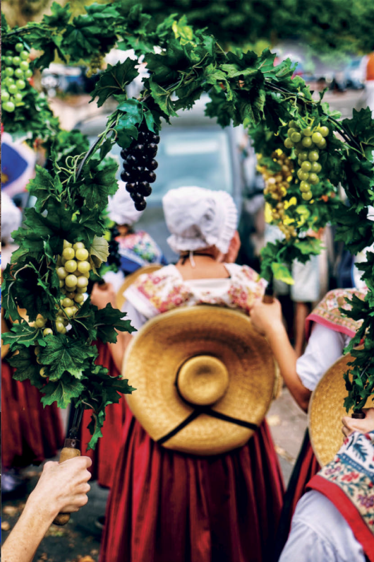
Fête du Raisin, Fréjus