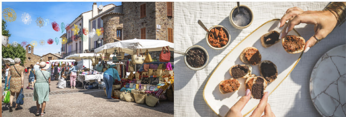
Marché de Roquebrune-sur-Argens

Les restaurateurs aiment y choisir leurs fruits et légumes, épices et aromates, pour une cuisine typiquement provençale et méditerranéenne. La sélection minutieuse de bons produits est à la base d'une cuisine saine et savoureuse. Ainsi le chapon à la provençale, la bourride, l'aïoli ou la pêche du jour sont autant de mets à déguster chez nos restaurateurs.