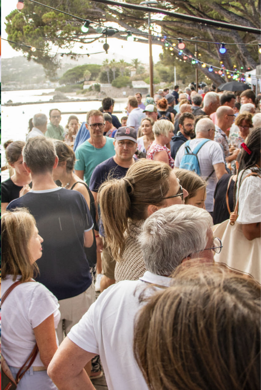
Fête des vigneron, Les Issambres